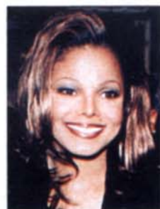
Janet Jackson Die Popdiva ließ sich ihr Gesicht und den Busen verschönern