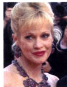
Melanie Griffith Mehr Oberweite, und auch die Lippen wurden aufgespritzt