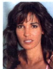
Nadja Abd El Farrag Mit größerem Busen auf Erfolgskurs im Show-business