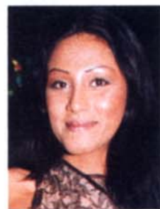
Sabrina Setlur Die Rapperin punktet mit größerem Busen und neuer Nase